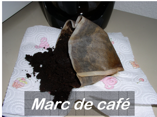
Marc de café

Elle repousse les insectes; disposée sur le dessus de votre tas, elle met les matières sucrées à l'abris des moucheron