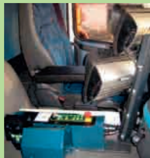
Commande embarquée du « bras » de levée des bacs dans la cabine du véhicule, avec caméras de surveillance.