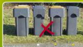
Bacs trop serrés et alternés