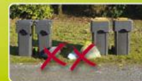
Sacs à côté des bacs

Je ne dépose pas de sacs poubelle à côté des bacs, ils ne seront pas collectés :