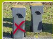
Attention DANGER: bac décalé et sur la route.