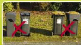
Bacs à l'envers

Je regroupe les bacs noirs ensemble et les bacs jaunes ensemble, et je les espace de 25 cm environ :