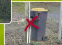
Bac trop proche de la haie

Je n'attache pas de sac ou tendeur autour de mon bac :